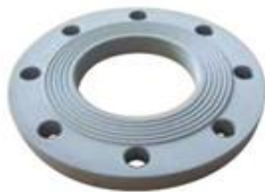
BRIDA PVC ROSCADA O LISA PASANTE