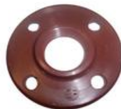
BRIDA PP ROSCADA