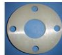
BRIDA PP FUSION